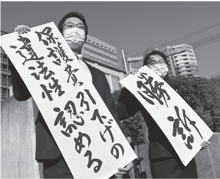
生活保護費引き下げ取り消しを求める訴訟の判決で「勝訴」掲げる原告側弁護士 (2月22日 大阪市内)

東京五輪は中止すべき チン接種が始まったところだ。菅義偉首相は、「人ろだ。先月、WHOのテ類がコロナに打ち勝った ドロス事務局長は、開発 途上国でワクチンを確保 迎え入れるというのか。 療現場に壊滅的ダメージ するが、五輪とコロナ克 できていないことに「破 策だけで5000人の医 国内ではようやくワク しかねない」と警鐘を鳴 療関係者の確保が必要 連の倒産件数は1000