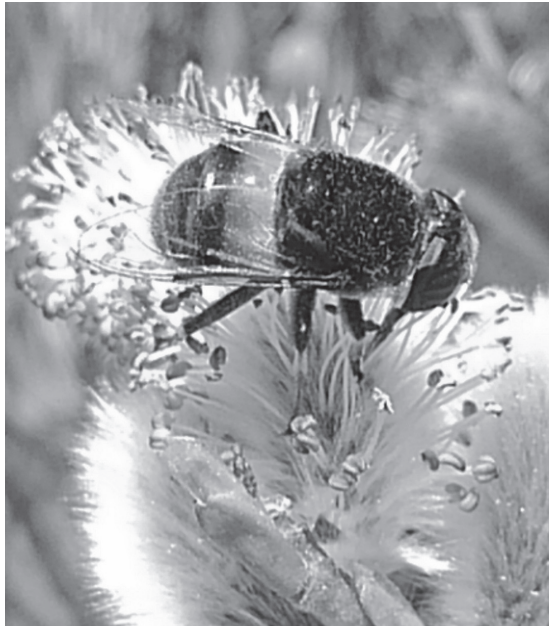
陽気に誘われて蜜を吸うハナアブ、受粉の手助けを受けるネコヤナギニ撮影・阿手類 (2月21日、万博記念公園/大阪府吹田市)

この中では、県内から辺野古埋め立て用の土砂採掘が喫緊の課題です。どこかと結託した業者が暗躍中です。