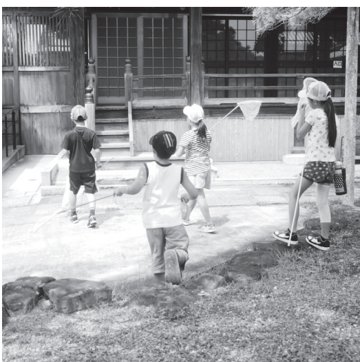
虫取りで走り回る子どもたち

あの3・11からまもなく10年。揺れる大地と押し寄せる津波、続く福島第一原発の爆発。それからの被害の実相を知れば知るほど「何もわかっていなかった、何もしてこなかった」と、焦る思い