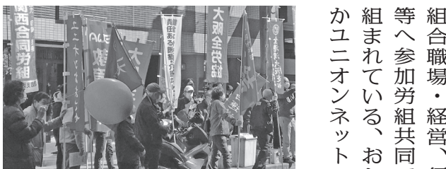
大建コンサルタンツに申し入れ (3月24日、大阪市中央区)

日本郵政本社前では「ストライキ突入集会」が開かれ支援の労働組合などとともに、「コロナ禍でこそ生活できる賃金の引き上げを」「最高裁決定に対応した非正規雇用労働者にたいする格差の是正を」「制度の改革を実施せよ」と訴えた。