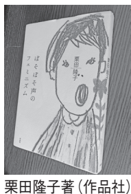
栗田隆子著(作品社)

労働運動を中心にかかわってきた私にとって、とても大事なことが書かれている本だった。 著者は73年生まれ。非正規雇用で働きながら女性の貧困や労働問題などに取り組んできた。そんな著者が経験し、疑問に思ってきた能力主義、男性中心の社会で(社会運動でも)生きていくこと