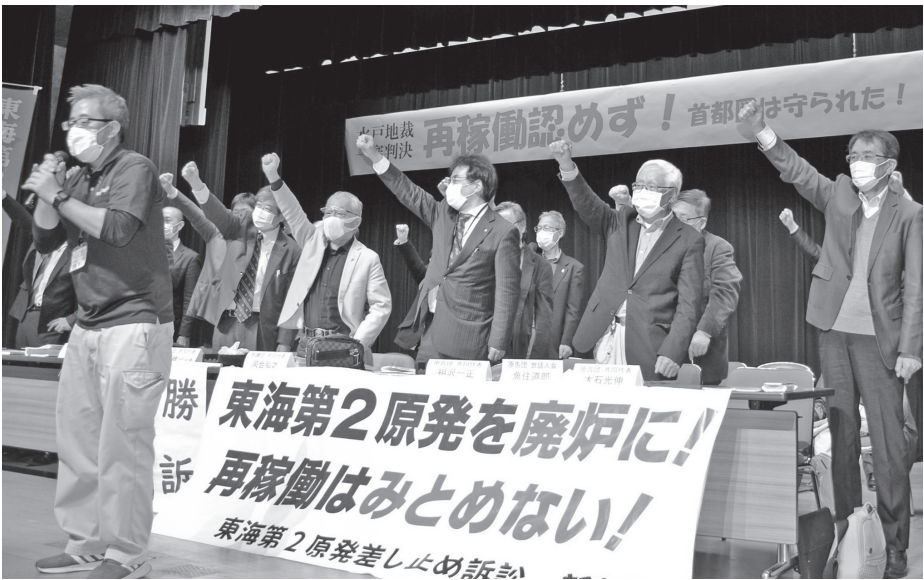
東海第2原発の差し止めを命じる水戸地裁判決後の集会で勢を上げる原告ら(3月18日、水戸市内)

こらないうという保障はないと判断。最後の頼みの綱ともいえる避難計画に実効性がないと、原告側勝利の画期的な判決だ」と述べた。