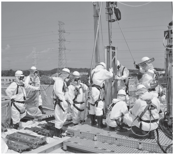
福島第一原発の汚染水を貯蔵するタンクの底板補修工事 (2015年7月22日)

2014年から15年、死亡事故を含む重大労災事故が頻発した。東電は、安全より工程優先であったことを認め、改善策を発表した。その直後は労災事故が減少したが、再び上昇している。