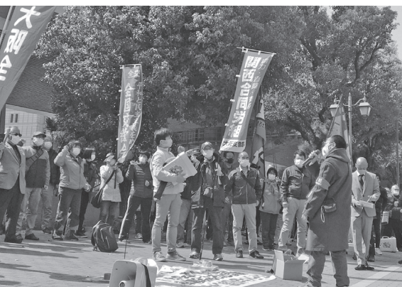
大阪地裁前で不当判決を弾劾 (3月15日)

また労働組合法1条2項の刑事免責については、事実上反して、「輸送運賃の値上げは組合員の労働条件に影響しない」とし、「ストライキは労働組合の正当行為とするには限度を超えている」とした。労働協約を反故にした資本をこれほど擁護する判決は、かつてないものだ。つてないものだ。そもそもストライキと