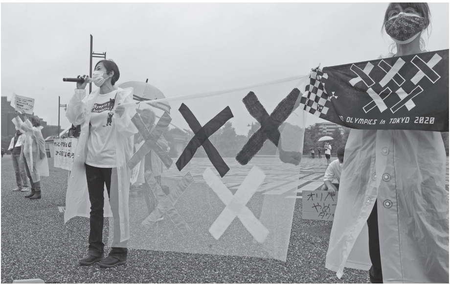
聖火リレー第1日目に 駒沢オリンピック公園総合運動場の前で、東京五輪開催に反対を訴える人たち(9日午前、東京都世田谷区)

五輪開会を目前にした「ト」になるのは必至だ。では、自民党が事前の予想を20議席近く下回った。言が発出された。にもある。各種の世論調査で、東京に「緊急事態宣言」も6〜8割が開催に反対。4日投票開票の都議選対。失われ、医療従事者には過酷な負荷がかかっている。失われ、医療従事者には過酷な負荷がかかっている。失われ、医療従事者には過酷な負荷がかかっている。