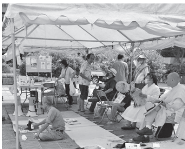
宗教者による抗議のハンスト

私の住む読谷村喜名集 この飛行場（今は落は、もともとは東に読谷飛行場）建設は、谷岳（クール山）が東西 1943年8月、突如として民家を立ち退かせ、