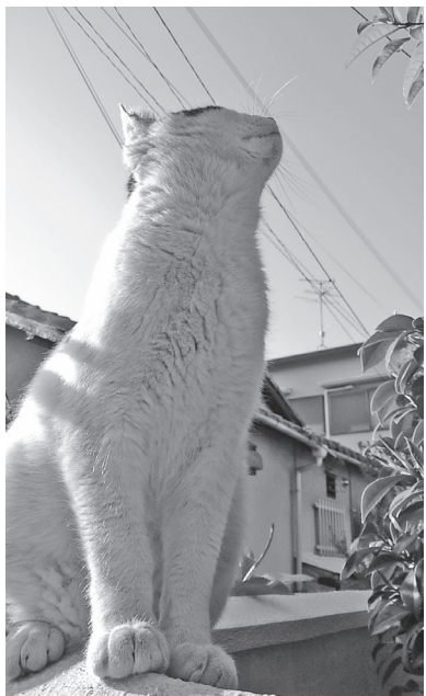
うーん、いい風だ。きっと今日もいいことがある。(猫村 2021年4月11日撮影)