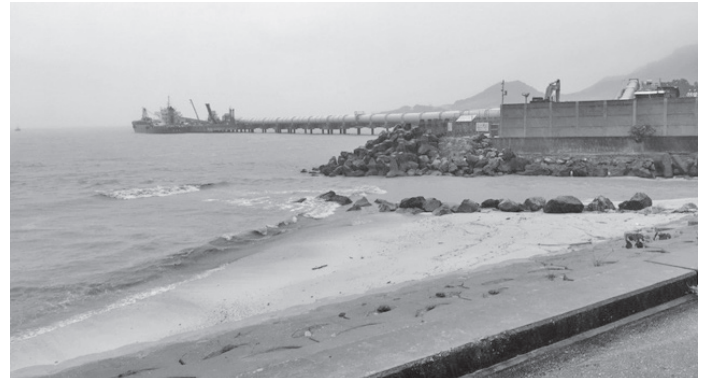
豪雨で赤茶色に汚れた安和棧橋付近 (今年7月初め)