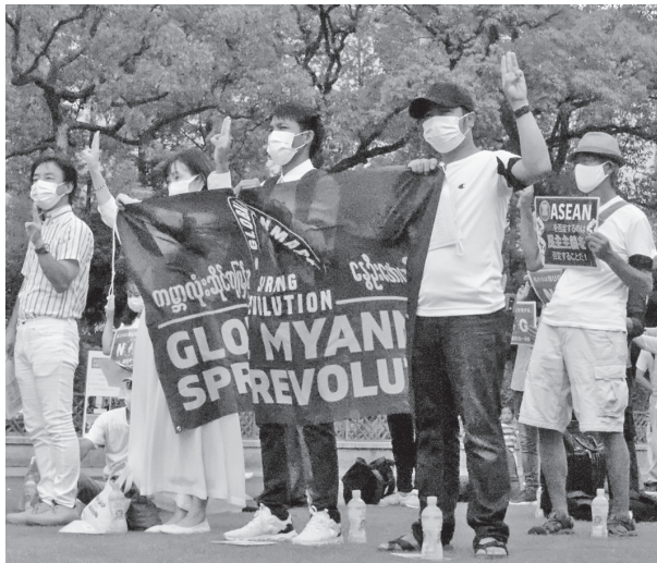
抗議集会で3本指をかかげるミャンマー青年たち(7月18日、神戸市内)

ミャンマー軍のクーデターに抗議する集会和デモが、7月18日、世界16カ国で同時開催。神戸市内の東遊園地には約150人が参加。連帯支援する日本人参加者も多かった。東京、名古屋、岡山でも開催。 主催したミャンマー青年は、「ミャンマー民主化のため、国民統一政府(NUG)を支持する」 「ミャンマーの課題は世界の課題であり、もっとミャンマーに関心をもちたい」とASEAN諸国は、問題解決に