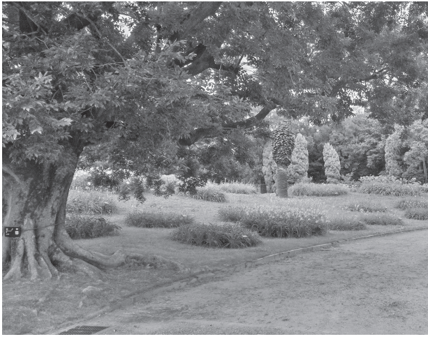
へメロカリス園 撮影日: 6月27日 長居植物園の一角にある。なんとなく南国風。手 前の大木はエノキで私の好きな木だ。これほど大 きくなるにはどれほどの年月が必要かと思う。(民)