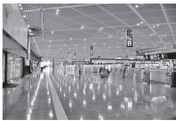
人影がない成田空港の出発口

「取調べの刑事がこうだろう、小さい『っ』だ」など、石川さんに一字ずつ説明しながら、脅迫状を届けに行った「架空の道筋を書かせている