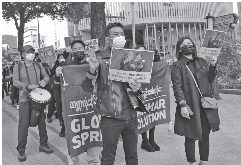
「軍事政権への支援やめろ」(10月31日、神戸市内)

人びとは、家庭でも学校でも職場・地域でもずっと競争に駆り立てられている。そして、競争から脱落しても「自己責任」として放置される。しかもそんな「競争社会」がおかしいという声も聞こえない。そういう孤独と不安と焦燥で、ものを