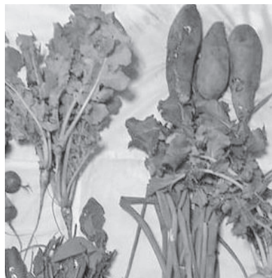
三里塚産直野菜は有機無農薬。毎週・隔週、「お試しセット」もあり。 【お問い合わせ】 TEL/0799-72-5242 関美 E-mail/kanjitsu_mail@yahoo.co.jp

この他、ドキュメンタリー番組「骨」(毎日放送、9月26日深夜放送)の制作担当者が、最初は、昔の墓から骨を発掘、研究するのは悪いことではないのでは、という意見もあった。しかし、