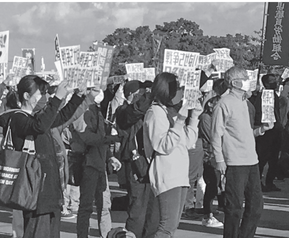
「戦争させない、9条壊すな」 11月3日、神戸市内で開かれた憲法集会