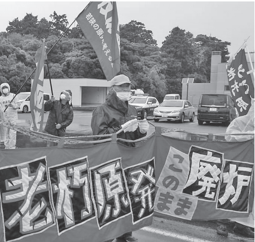
関電原子力事業本部に向けてデモ (10月25日、福井県美浜町)

「2050年には、温室効果ガスについて、排出量から吸収量と除去量が差し引いた合計をゼロにする。」 「原子力」の本当の狙いは「脱炭素」をもテコにして強引に原発を推進し、再エネをできるだけ抑制し、大手電力会社を防衛することだ。