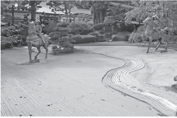
(撮影 10月 神戸市内 須磨寺境内 mac)

「返せ給へ」須磨の浜に迫る熊谷次郎直実、手綱を引く平敦盛17歳。「祇園精舎の鐘、盛者必衰…たけきもついに滅びぬ」平家物語の後段、「敦盛最期」。こ