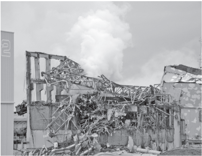
爆発直後の東電福島原発3号機 (東京電力HPより)

「安定供給」「経済効率性」に照らせば、再生可能エネルギーは不安定で非効率とされる。それにたいして、「原子力は、燃料投入量に対するエネ