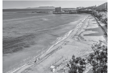
タイガービーチ (恩納村)

米軍の統治下に、沖縄 復帰時の72年、観光客 県は米軍基地経済に依存 していました。日本復帰 博(75、76年)が開かれ、 跡地は海洋博記念公園 (76年)となり、美ら海 水族館がオープン(02年) し、海にも島にも陸にも つ。平和産業として、私 も賛成です。