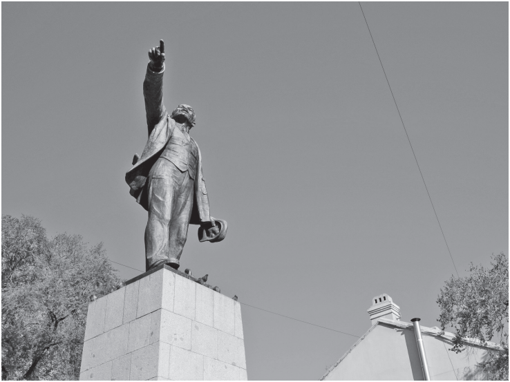
ロシア・ウラジオストク駅前の広場に立つレーニン像

「国家が人民を指導する議会制度を導入したヨーロッパ諸国の労働者のみじめさ、ブルジョアジーの腐敗を知るトカチヨフは、民主主義制度に何の信頼も置いていなかった。革命に勝利しても民主制を採用してはならず、「少数者」が指導する国家に全権力を集中しなくてはならない。何