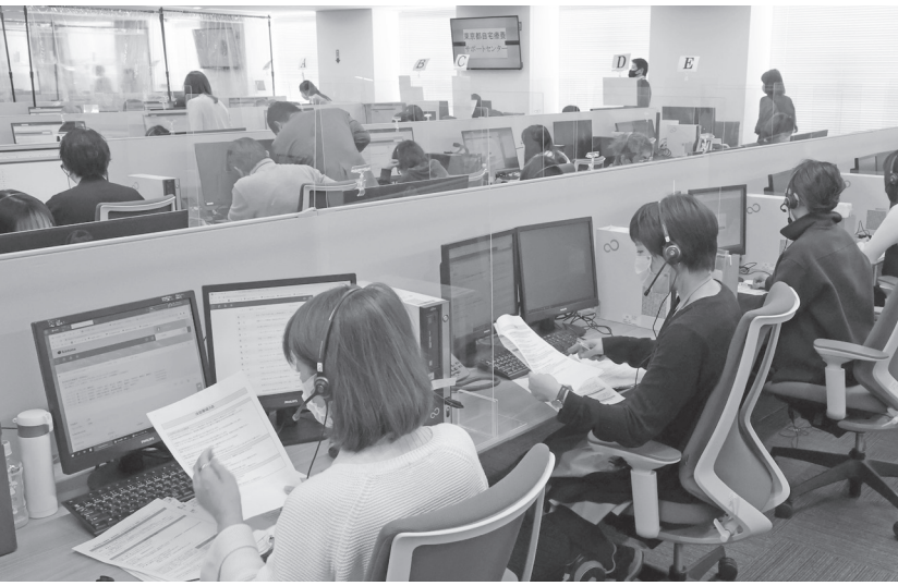
東京都が開設した、新型コロナウイルス自宅療養者用の電話相談窓口(1月31日)