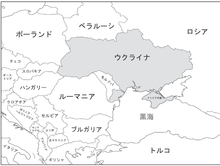
ウクライナとその周辺国

19世紀以来の国際政治 治力・軍事力・経済力の はイギリスの世界覇権を “強みと弱み” を自覚し 軸に動いてきた。いち早く、世界の覇権国と く産業革命に成功したイギリスは、産業資本によ る資本蓄積を実現し、その歴史的な事件のほとん ここで蓄えられた経済力を どのにおいてイギリスは 背景に強大な軍事力(と 陰に陽に参与してきた。 りわけ海軍力)を形成し、1840年のアヘン戦争、 世界中に植民地を拡大し 1854年クリミア戦争、 た。イギリスは自国の政 1868年の明治維新、