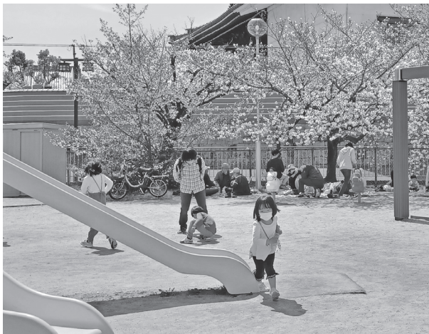
郊外の小さな公園も桜が満開。お弁当もそこそこに子どもたちは遊び回る。シャッターを切りながら、ウクライナの子どもたちに1日も早く平和を、と思う。(撮影 3月30日 風子)