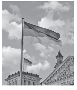
混迷する連立政権

CDU/CSUと連立政権を組んでいる間に凋落した社民党だったが、最近社民党青年部(JUSOS)委員長ケヒン・キュナートは若手の突き上げによって変わってきた。彼らは「社会主義」の強調と「大連立反対」で、リスト教民主・社会同盟と社民党の連立政権下で、脱原発への転換や徴兵制「中断」をおこなった。シュレーダー元首相はロシアのプーチン大統領と