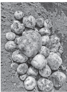
三里塚「産直野菜」は無機無農薬。毎週・隔週、「お試しセット」あり。

7月16日(土) 今も雨が降りそうな空だったが、人通りは多い。参加18人、署名数25筆、チラシ配布160枚。札幌