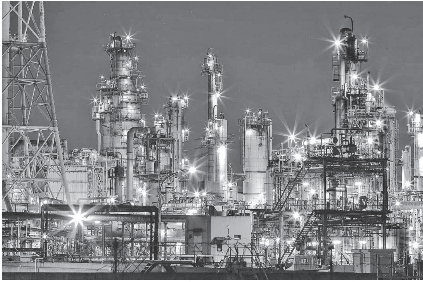
堺泉北コンビナート

前回見たように、維新 中心に事業所数も雇用者数も大きく減少してきている「グローバル化に投資すること」が大阪経済の再生の道だという。たしかに、大阪経済は、長期にわたって疲弊・衰退している。日本の主要都市の「県内GDP(実質)の推移」や「一人当たりの雇用者報酬の推移」で、大阪は下位にあり、地域経済を担う中小企業を