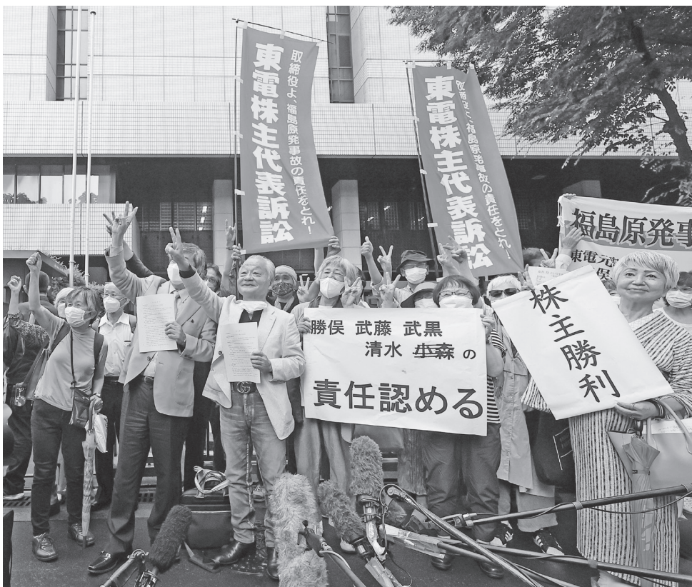
東電株主代表訴訟の判決後、裁判所の前で「株主勝利」などと書かれた紙を掲げる勝訴を喜ぶ原告ら(13日、東京都千代田区)