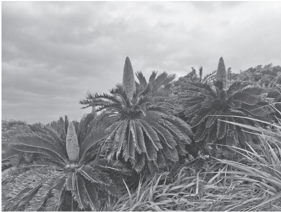
蘇鉄の花 (沖縄 恩納村 撮影: 6月上旬、庄)

恩納村万座毛の巡回コースを回っていたら、ソテツの花に出会った。少し調べてみた。ソテツは雌と雄の株が別々に存在する植物で、雌株と雄株がそれぞれ違う形の花を咲かせる。写真は雄花。ソテツといえば、田端義夫さんの「島育ち」という歌がある。仲宗根美樹さんの「島育ち」もい