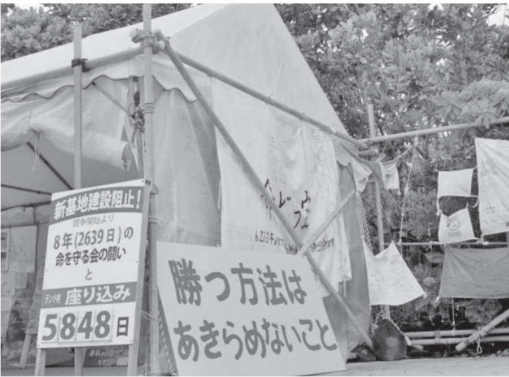
辺野古浜に立つテント村= 2016年11月撮影