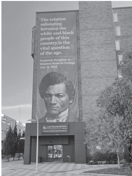
キャンパス内に設置された著名な奴隷制廃止論者フレデリック・ダグラスの演説を記念するパネル。

こうして今や非営利の自治体開発企業が全米に4500社、労働者所有企業が1万1000社、生協、農協、信用組合、何らかの協同組合に組織されるアメリカ人は1億3000万を超えている。全国で非営利ないし自治体運営の不動産トラストが低所得者向け住宅を運用し、「第四セクター」と呼ばれる「社会的企業」が増加している。さまざまな経済的民主化のノウハウを総合したケースとして「クリーブランド・モデル」が注目を集めている。ここでは、30億ドルの購買力を持つクリーブランド・クリニック、大学病院、ケイ・ス・ウエスタン・リザーブ大学(全米トップクラスの理工系私立大学)と