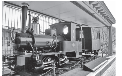
写真の1号機関車(1888年製)は愛媛県松山市の梅津寺公園に保存されているもの

旧暦9月14日に皇居に 来るように言われたの で、伊江王子らは祝賀を 述べようと思いましたが