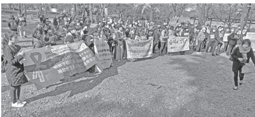
火曜日行動500回を記念する集会=13日、大阪市中央区

この日、大阪城公園(大阪市中央区)で500回を記念する集会が開かれ、大阪府庁周辺でミニ