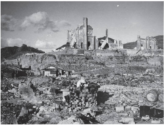
本尾町西部地区(現在の長崎市平和町)から浦上天主堂の南西部を見る。=撮影1945年、長崎原爆資料館所蔵

浦上天主堂は、長崎の浦上地区の中心部の高台に建てていた教会堂です。米軍が投下した原爆の爆心地からは、直線距離で1kmもないような直近です。被災直後の写真を見て、ほとんどの建造物が一瞬にして燃え尽