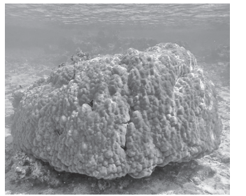
ハマサング=沖縄県石垣島沖にて撮影

沖縄の海中の景色は陸のうち、現在も生き残った上りきれい。サングや魚などが彩りをなしているのは2群体だけ。そのうちの1群体は「全体的に白化が見られる」という、生き残りが危ぶまれる状況です。 防衛局が示した最終的な評価は、移植先に元々生じていたサングの死亡率と同等であることなどを踏まえ「移植先において十分に順応している」と総括しました。 びっくりする結論でやっつけのけたのです。あれから5年。ハマサング9群体のうち、辛うじて残っているのは1群体だけだという。それ