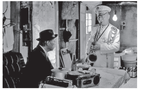
「軍艦マーチ」を演奏するシーン

ワン監督は、「すみません」という日本語のセリフが出てくるシーンについて次のように語っている。「日本語で『すみません』と言うと、それは日本語の教育を受けて、自分分は日本人だと言われ、自分も日本人だと思っ 10月14日、この映画の上映会が京都大学で行われた。主催は自主講座「認識台湾」である。「台湾有事」が喧伝される中で、「私たち台湾人」という意識がどのような歴史的経緯の中で形成され、そこにあって、本