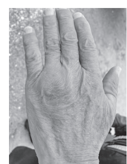
川柳 秋秋 怪我をして芸のコヤシと信じてる 午後休を取って職場にいた男 歯の本数減っても続く反抗期 伝説の酸っぱい人を選ばれる 底抜けに楽しいことがありました 底抜けのボートの着いた無人島 ど根性なければ描けぬ鉛筆画 宇宙よりでっかい夢とニトロ口持つ 止まらずに歩きましょうとある廊下 非核宣言守り続ける神戸港

「フェミニストは女性優位で男性嫌い」「髪の毛の短い女はフェミニスト。短髪だったことを理由に、「メダルを返せ」とSNSで執拗に攻撃された。