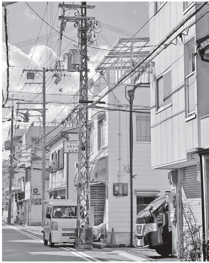
関西合同労働組合の近くにある、旧神戸市電の架線柱。鉄製で、戦争中は空襲をうけた。1971年の市電全廃後は一般電柱に転用され、さらに阪神淡路大震災にも耐えた1本。かつては市内あちこちに見られたが、今や数えるほどしか残っていない。(撮影：神戸市長田区、Lazy)