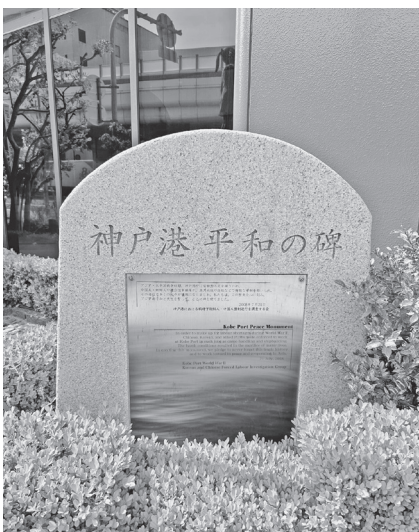
神戸港平和の碑: JR元町駅西口を南へ約10分、神戸華僑歴史博物館前

強制労働の日々…。神 戸空襲の際は、燃えさか する火の中で捕虜たちがバ ケツリレーで消火活動 していた。彼らは市民とともに、 会は、日本と捕虜に関する 数少ない歴史資料が散 逸し、忘れ去られようと