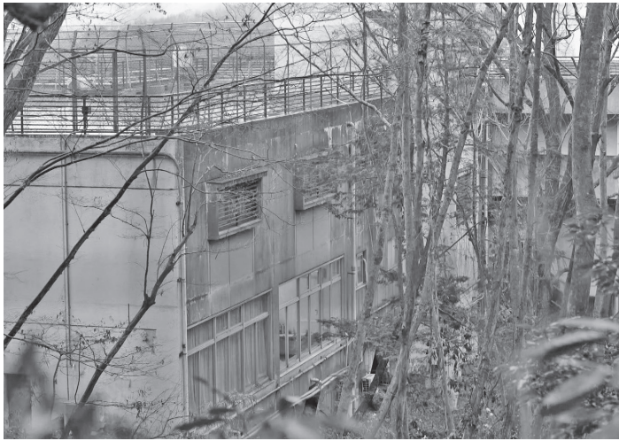
患者への虐待が繰り返されていた東京都・八王子市の滝山病院

その上、行政が患者の立場に立つことはほぼない。その監督機能はせいぜい弱というよりも病院を敵には絶対に回さない。神出病院においても、およそ人間にすることではな