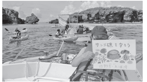
昨年12月14日に行われた海上大行動＝名護市

カヌーチームの二人の報告会。私は司会として、あいさつ。「昨年末、代執行裁判で大浦湾の埋立てが焦点化しました。しかし、年が明けると自