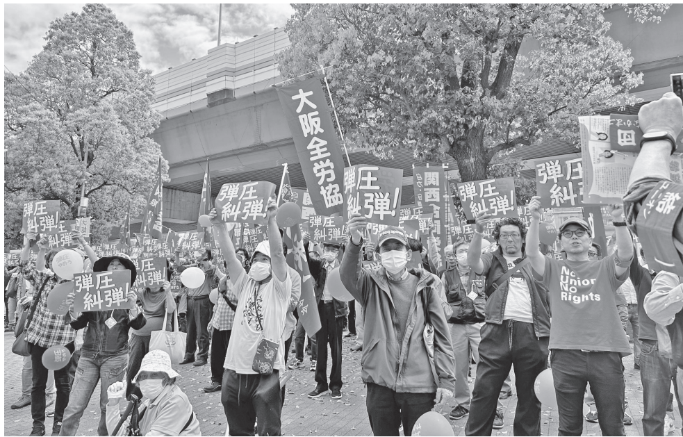
「弾圧糾弾」のプラカードを一齐に掲げる集会の参加者たち=4月7日、大阪市内

陸自訓練場計画 住民の力で撤回 沖縄県うるま市 木原稔防衛相は、4月 11日、沖縄県うるま市で 進めていた新たな陸上自 衛隊の訓練場建設計画を 撤回した。新たな訓練場 は、住宅地から道路を挟 んで10メートルのところ に建設予定だった。3月 20日には、市内外の17団 体が主催する市民集会に 1200人以上が参加。 訓練場反対の市民の強固 な意志を示した。集会で はそれまで賛否を明らかに しなかった中村正人市 長は、住民の力に押され るかたちで「白紙撤回に 向けて最後まで頑張る」と 表明していた。防衛省 は沖縄本島内での訓練場 建設を諦めていない。玉 城デニー知事は記者会見 で「まず米軍基地の目に 見える縮小がなされるべ き」との考えを明らかに した。