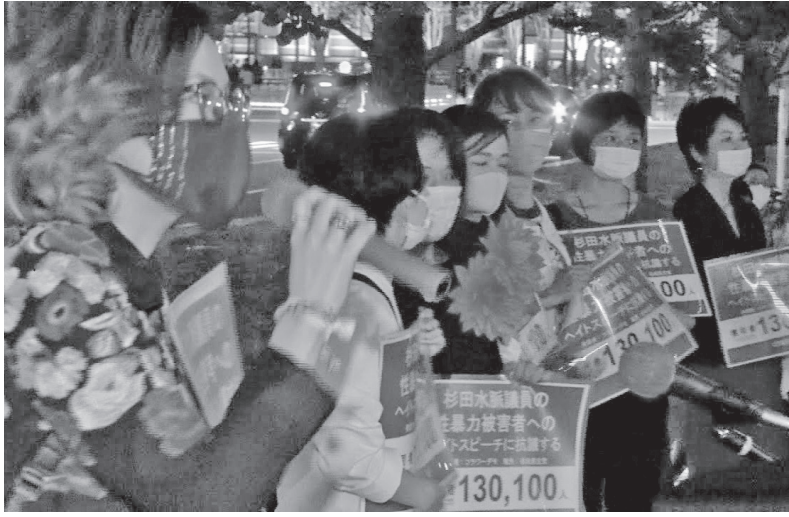
杉田水脈の議員辞職を求めて行われたフラワーデモ＝2020年10月5日、東京