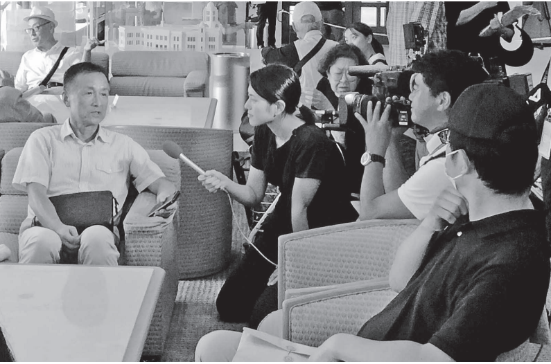
兵庫県議会の百条委員会を傍聴に訪れ、ロビーでマスコミのインタビューを受ける市民＝8月30日、神戸市中央区