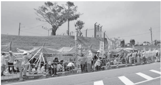
キャンプシュワブ・ゲート前の座り込み＝名護市辺野古、2014 年 9 月