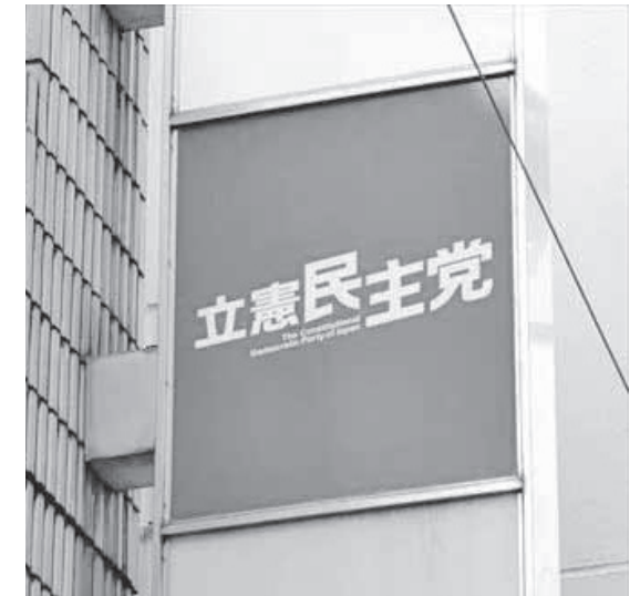
都知事選で立憲民主党が推薦する候補が惨敗

だから、石丸に投票する若者を見て「理解不能」「世も末だ」と年配世代が嘆くのも分かる。