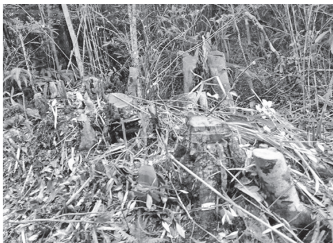
ヘリパッド建設のため伐採された樹木 (2016年8月28日)

県と国との二辺野古新基地建設」和解が3月に成立し、いったん国による辺野古の基地建設工事は停止した。ちょうどその時期の7月11日、米軍500名の機動隊員が現場に到着した。