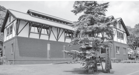
賀川豊彦記念館 (徳島県鳴門市)

展していった。1916年に『優生学―人類の遺伝と社会の変化』（斎藤茂三郎）が出版され、1924年には後藤龍吉が日本優生学会を設立した。