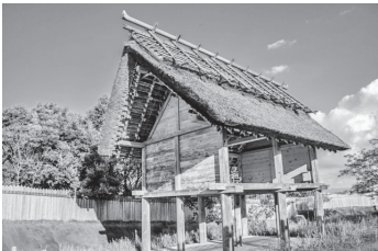
青銅器を铸造 吉野ヶ里遺跡