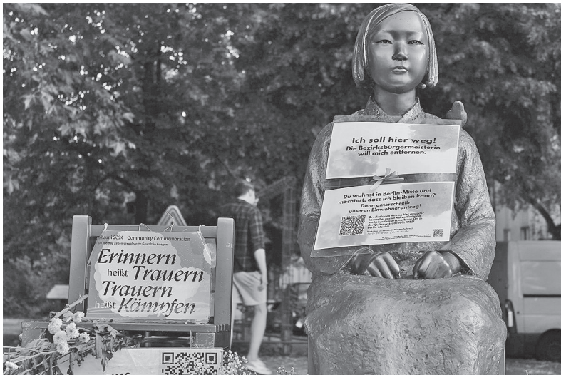
ドイツ・ベルリンにある平和の少女像