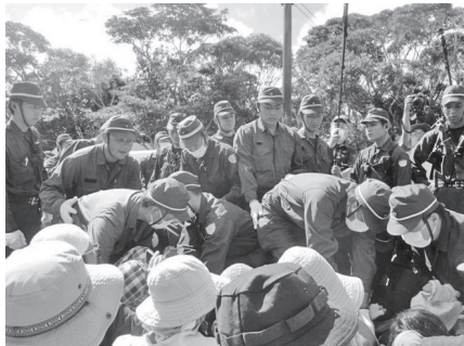
座り込みの市民を排除する機動隊員＝2016年10月8日、沖縄県東村高江

設断念を求める たまま…。米軍基地に所 「建白書」を携 属する米軍人や軍属によ えて、東京・銀 る、度重なる県民、特に 座をデモ行進し 女性への被害が起こって た時、沿道から いるにもかかわらず、日 右翼が罵詈雑言 本国憲法の上に置かれ を浴びせ、沖縄 る「日米地位協定」のも への差別感情を と、多くが「泣き寝入り」 むき出しにし させられている現状を た。これらの状 「沖縄差別」と言わずし てなんと云えばいいだろ うか。