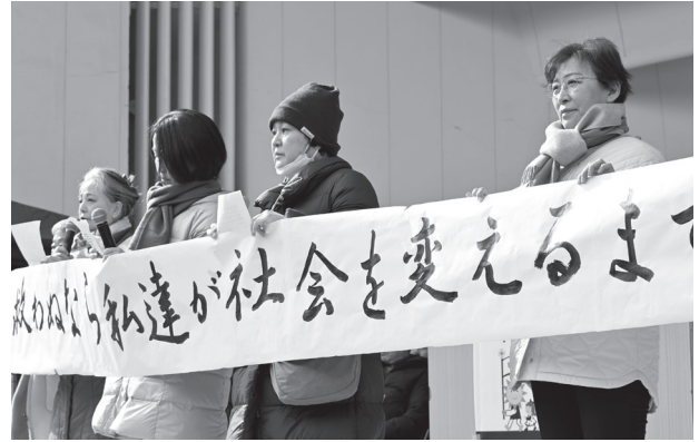
横断幕を手に登壇した原発賠償京都訴訟原告団＝3月7日

原発賠償訴訟京都原告団のアピールは、多くの参加者の心をとらえた。去る1月22日に最高裁は、