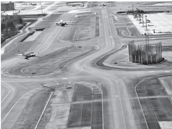
用地が確保できないまま工事を強行したため、大きく「へ」の字に曲がった成田空港の誘導路。専門家はその危険性を指摘。利益優先・安全軽視のN A Aの姿勢があらわだ。