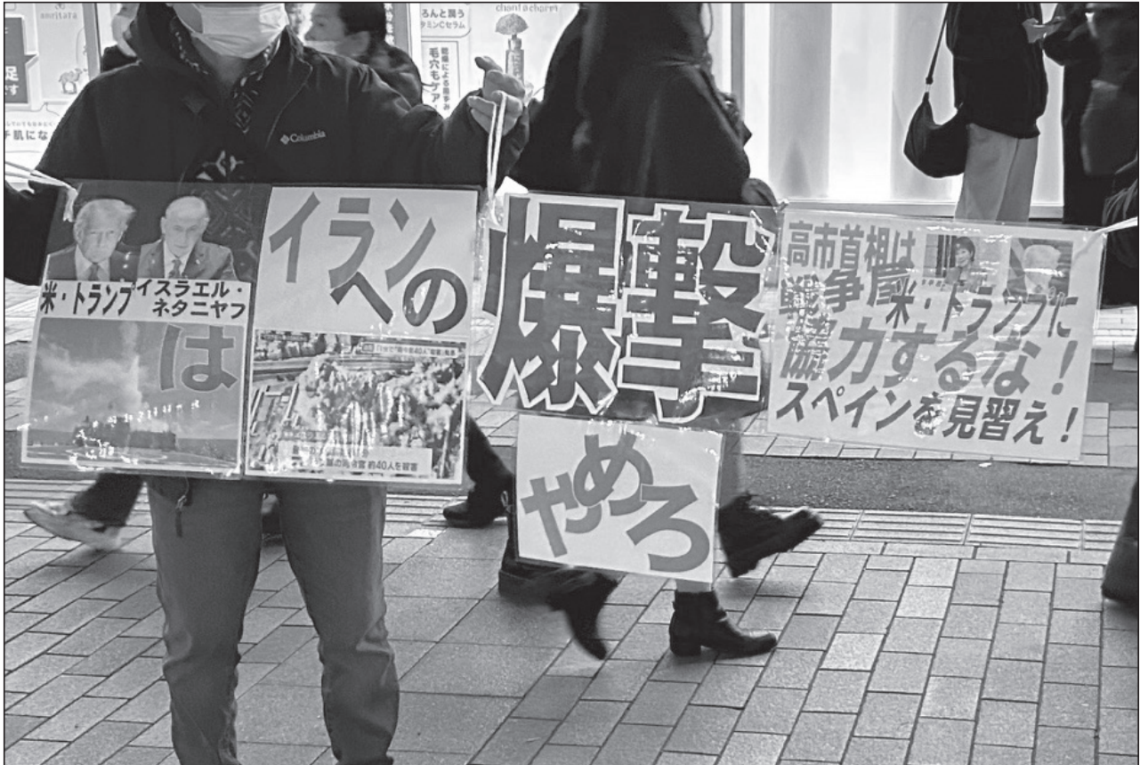
アメリカとイスラエルによるイラン爆撃に抗議の声を上げる市民たち = 3月11日、神戸市中央区三宮