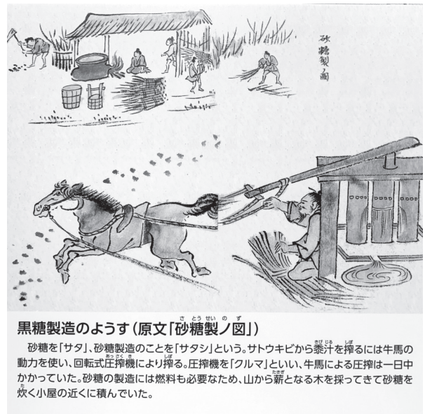
黒糖製造のようす（原文「砂糖製ノ図」）

政治である。重い租税を上納できぬ者や、わが身を抵当に借財したが返せなくなった者が、使用人として身売りし家人となる。借金を返せば自由の身に戻れると表向きはなっているが、年 3 割の利子が課せられており、解放される者はほとんどいなかった。幕末には家人は奄美の人口の 3 分の 1 にまで上ったといわれている。家人の子どもとして生まれた者はヒザと呼ばれ、これこそ生まれながらの奴隷で、死ぬまで主家につとめる身分だった。ヒザには年季もなく、その身の売買も主家の都合で行われ、ほとんど生殺与奪の権まで握られていた。結婚もヒザ同士に限られていた。過酷な待遇に耐えきれず逃亡を図ったり、自殺したりする者も多かった。発覚すればさらに過重な負担を課せられた。